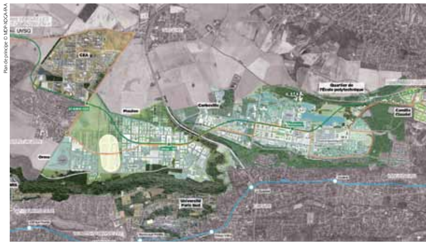
Le sud du plateau de Saclay, un campus urbain sur 7 kilomètres, du CEA à l'École polytechnique.

Créé par la loi du Grand Paris, cet établissement public a pour mission de développer un pôle scientifique, universitaire et économique centré sur le plateau de Saclay, à cheval sur les départements des Yvelines et de l'Essonne. Il mène ce projet en lien étroit avec les collectivités (villes de Palaiseau et de Saclay, CAPS, Conseil Général, Région...) et les partenaires académiques réunis dans la Fondation de Coopération Scientifique.